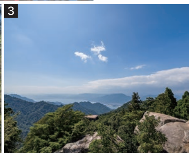
1 海上に浮かんでいるような厳島神社の社殿。2 宮島ロープウェイに乗れば、眼下に弥山原始林が広がる。3 弥山山頂から望む風景。4 ライトアップされた厳島神社。

※2 イザナギ、イザナミの二神が国生みの最初にこの橋の上に立ち、矛で海水をかき回してオノゴロ島をつくったとされる。