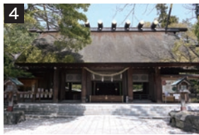
1 天橋立ビューランドからの眺望(飛龍観)。2 天橋立を通う松並木の遊歩道。レンタサイクルを利用すれば約20分で渡れる。3 傘松公園からの眺望(昇龍観)。4 元伊勢籠神社の拝殿。